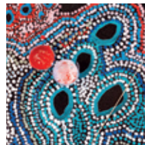
Detail Dotart © Spinifex Arts Project (oben) | Detail Kreuzschraffur © Buku-Larrngay Mulka (rechts)

Trotz vordergründiger Unterschiede ist beiden Kunstzentren gemein, dass deren Künstler ihre Malerei schon früh politisch einsetzten, um Land- und Seerechte gegen die teils bis heute fortwährende Enteignung durchzusetzen.